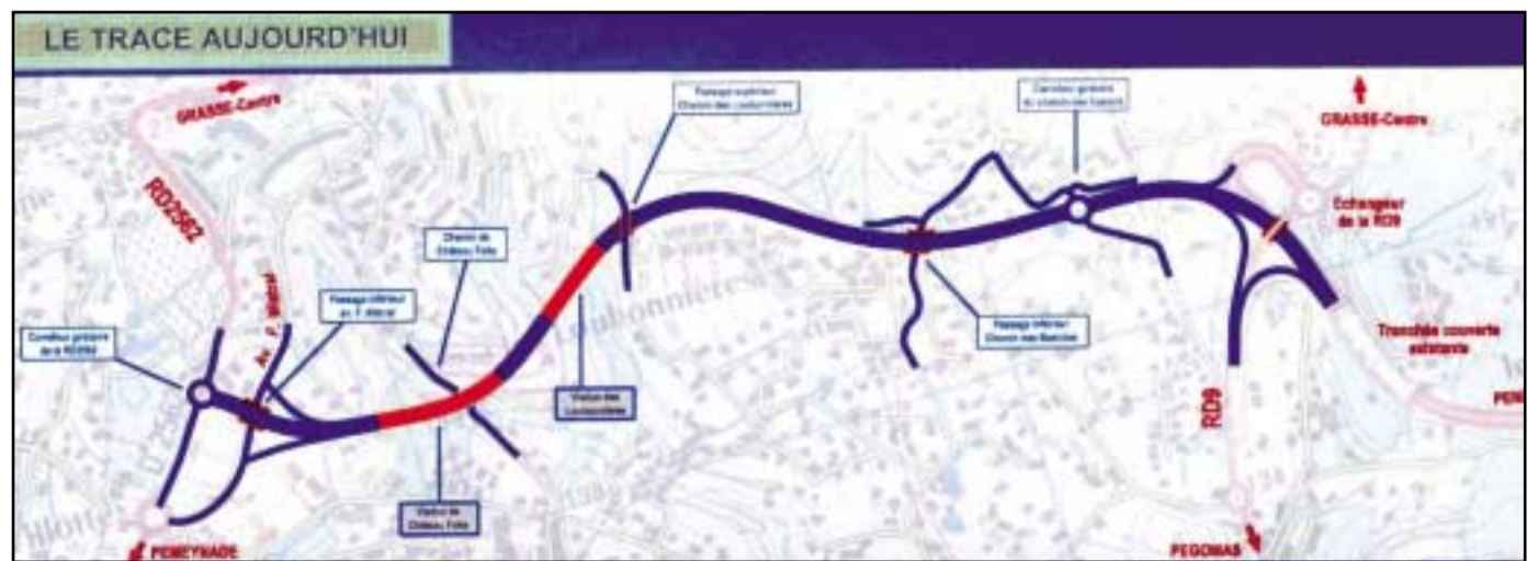
Le projet du Conseil général : une voie de transit à travers St Antoine et St Jacques.

Finalement, ce que nous propose aujourd'hui le Conseil Général, c'est non pas un achèvement de la pénétrante intégré à la voirie et l'environnement, mais une voie rapide sur laquelle il sera impossible d'entrer et de sortir sur 2,100 Km entre "Les Castors" à St Antoine et la sortie du Stade J. Girard à St Jacques qui sera transformé en gigantesque rond-point. Ce qui paralysera St Jacques, l'avenue de la Libération et l'avenue F. Mistral aux heures de pointe.